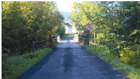
Most před opravou