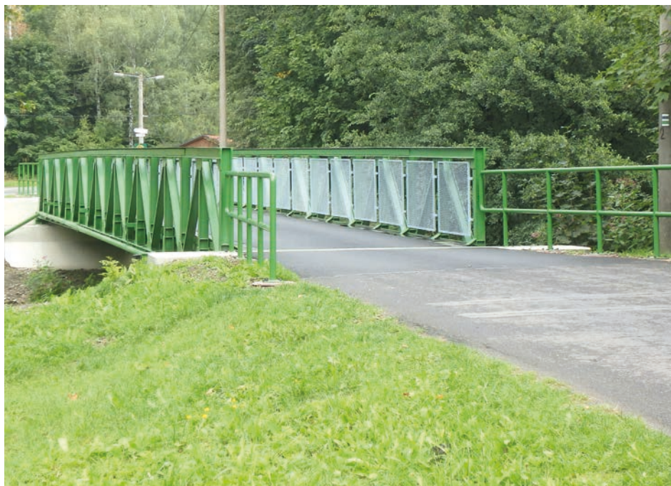
Most po opravě