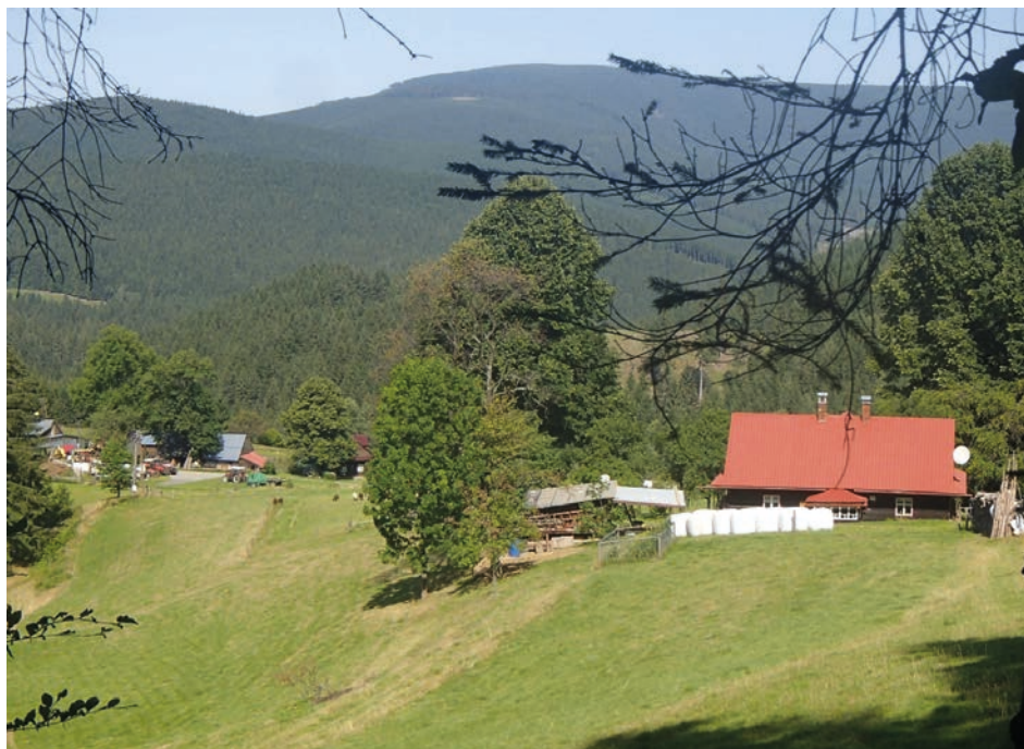
Nejvzdálenější polany nad Morávkou – Byčinec

I číslování školních budov odráží postupný vznik škol – nejnižší číslo popisné dostala nejstarší škola na Morávce na Uspolce 376. Naopak nejmladší školy ve Slavíci (639), v Nytrové (649) a v Lipovém (650), měly již čísla popisná značně vysoká.