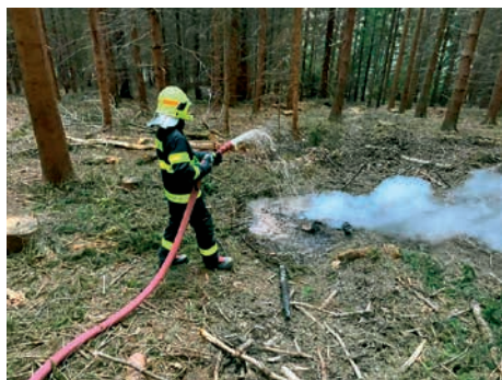
Požár po pálení klestí 29. 4. 2023