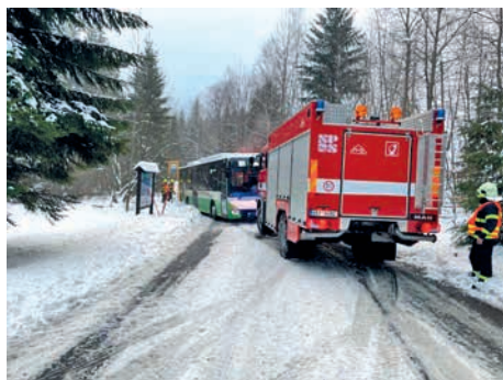
Zapadlý autobus 24. 1. 2023

Výsledkem je tedy 8 požárů, 10 technických pomoci s odstraňováním padlých stromů, 2 technické pomoci se zapadlým vozidlem, 1 ostatní pomoc se snesením pacienta k vozidlu ZZS.