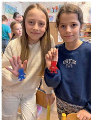
Reklamní předměty Hyundai