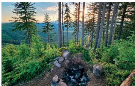
Neuhašené ohniště – Morávka Nad Kršlí 7. 7. 2023

V rámci statistického sledování předem ohlášených činností byly provedeny 4 likvidace obtížného hmyzu, 2 čištění studní, jedno čištění výpusti rybníka, jednou jsme asistovali při zvedání nemocného koně a 2krát jsme pomáhali při soutěži SDH Vyšší Lhoty.