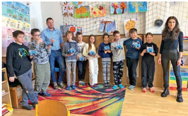
Výroba autíček s Hyundai