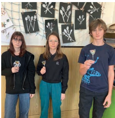
Výherci školního kola soutěže Mladý zemědělec