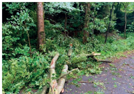
Strom přes komunikaci – Vysuté 17.07.2023