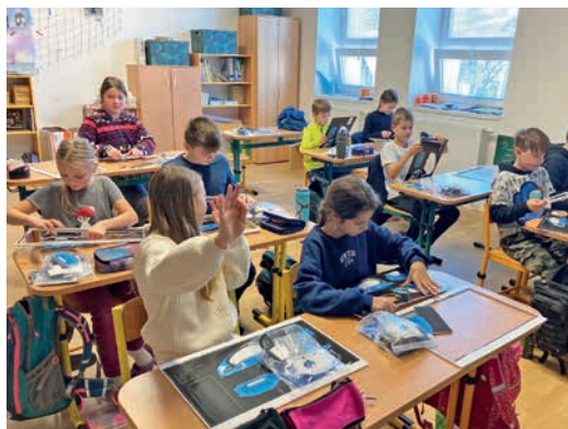
Žáci 5. třídy – robotika s Hyundai